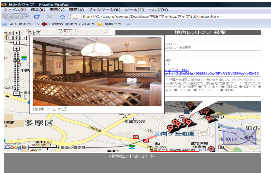
図 1：例題アプリケーションの実行画面