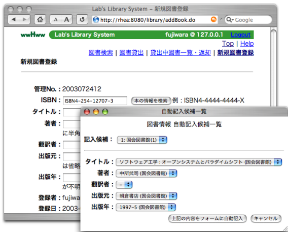
図 5 自動記入候補の選択画面例