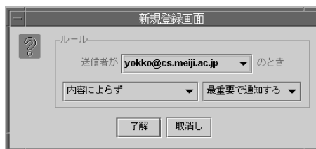
図 2: 送信者ルールエディタ

ユーザはメール到着通知を受けたときにその通知に関する評価をエージェントに与えることができる。評価は、ユーザが求める重要度をエージェントに通知す